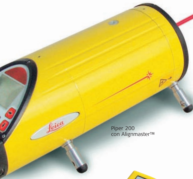
Piper 200 con Alignmaster™